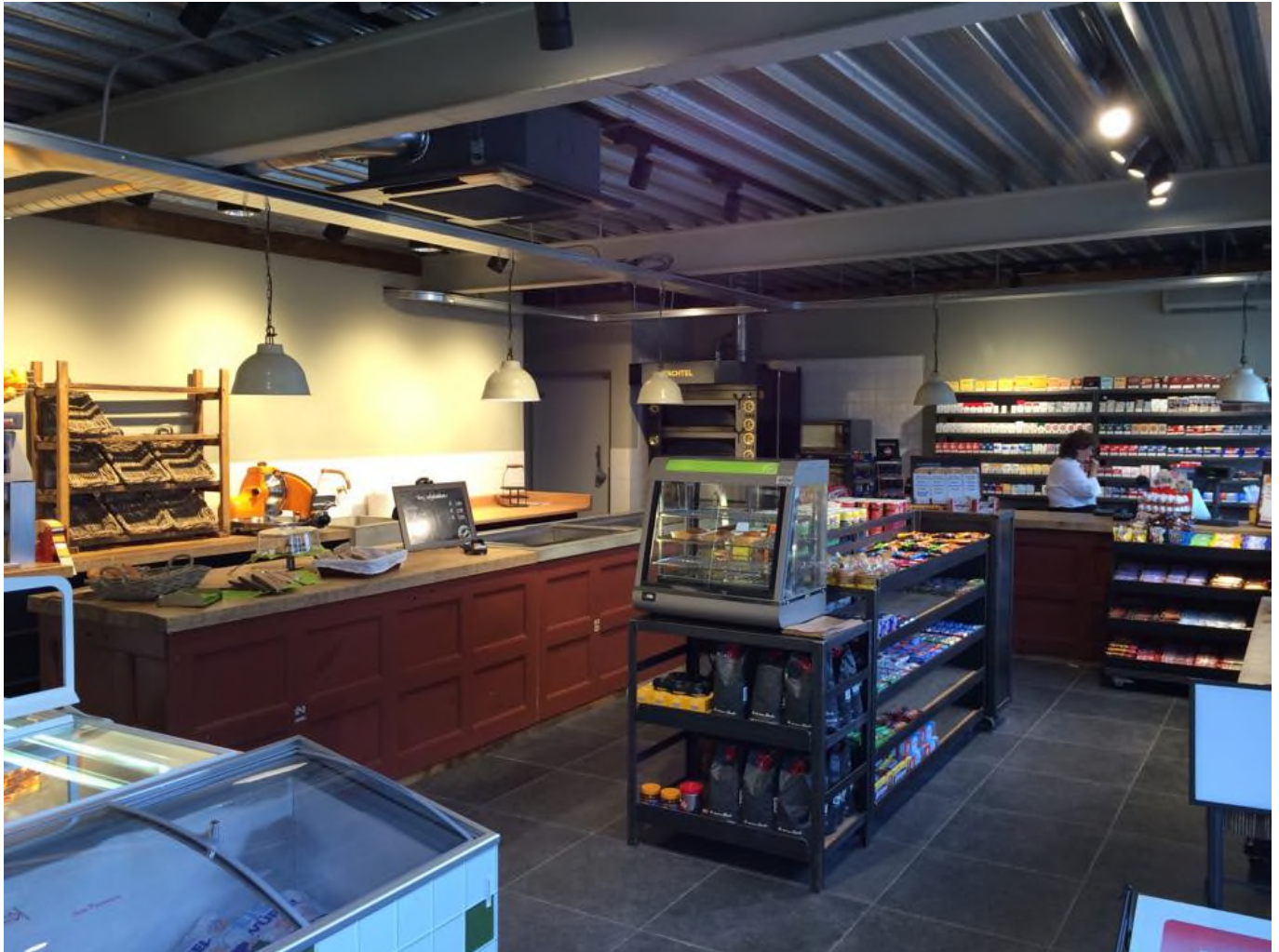
Duidelijk en logische routing