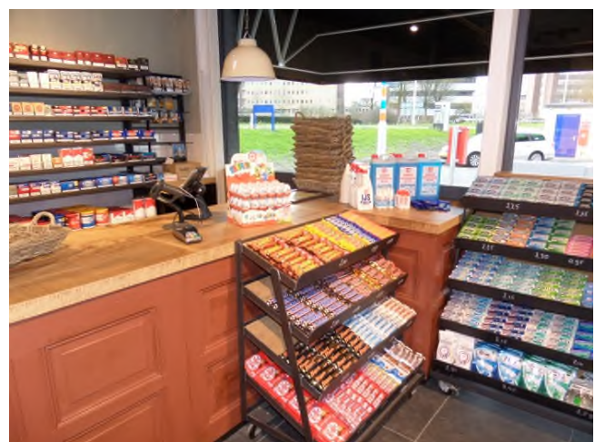
Rustiek interieur met luxe details